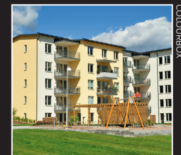
Regeringen har ett mål på 250 000 nya bostäder fram till 2020.