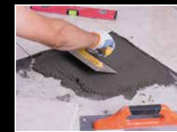
Gapet mellan plattsättare på ackord och dem på tidlön är 52:77 kronor i timmen.

Den eviga frågan – tidlön eller prestationslön. Varje löneform har väl sin charm med fördelar och nackdelar. Men för den som vill tjäna pengar är möjligheten att arbeta på ackord en utmärkt chans att dryga ut hushållskassan. Lönestatistiken talar sitt tydliga språk. Ackordsarbetarna är mer än någonsin byggets lönevinare.