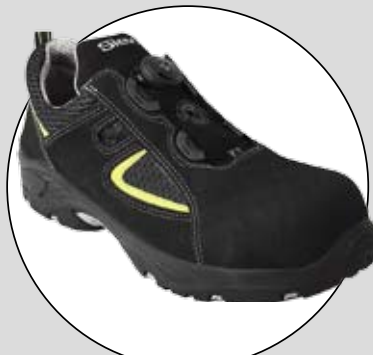
SIEVI ROLLER (SIEVI)