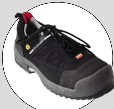
JALAS ZENIT (EJENDALS)

Betygen på respektive testfaktor är ett medelvärde av testpiloternas betyg. Slutbetyget är en helhetsbedömning som sätts av redaktionen. Där vägs kommentarer in.