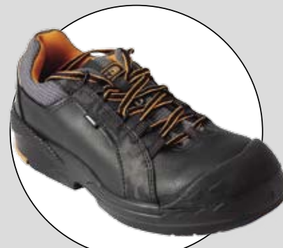
ARBESKO 252 (ARBESKO)