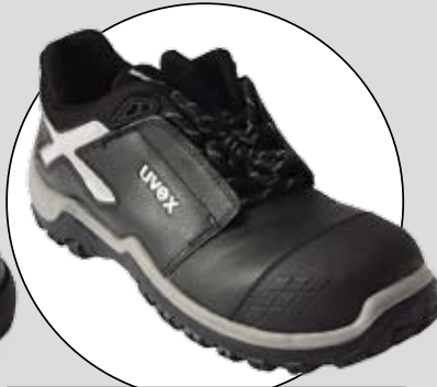
XENOVA PRO (UVEK)