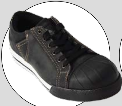
MONITOR STREET (BÅSTADSGRUPPEN)