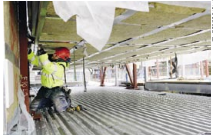
ANDRÉ DE LOISTED