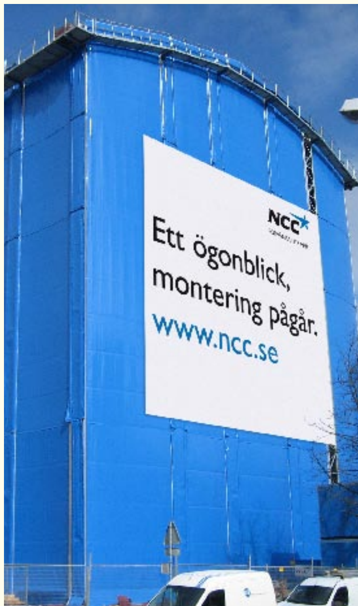
Byggnads kräver bygglöner när NCC bygger på löpande band, här i Eskilstuna. Men NCC har redan tecknat avtal med IF-Metall.