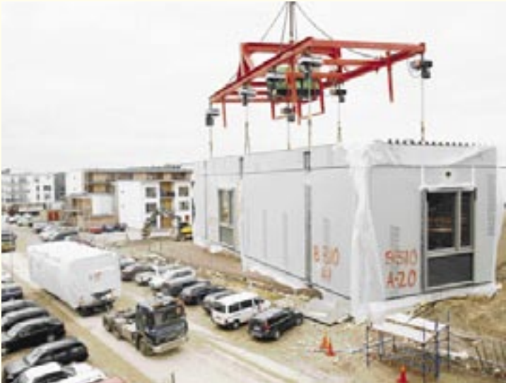
ANDRÉ DE LOISTED