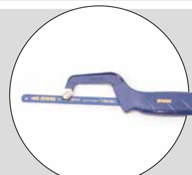
IRWIN (IRWIN TOOLS)