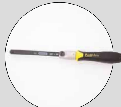
STANLEY FATMAX (STANLEY-BLACK&DECKER)