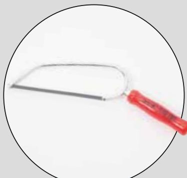
PUK UNIVERSAL MINI

Betygen på respektive testfaktor är ett medelvärde av testpiloternas betyg. Slutbetyget är en helhetsbedömning som sätts av redaktionen. Där vägs kommentarer och cirkapris in. Alla priser är inklusive moms.