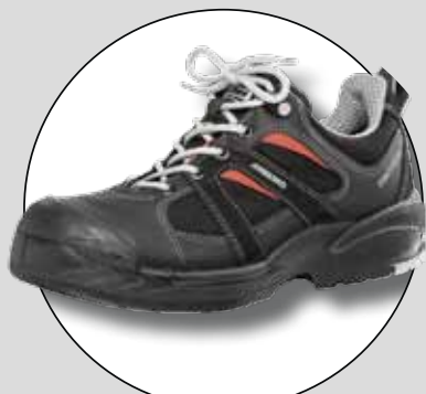
ARBESKO 382 (ARBESKO)

Betygen på respektive testfaktor är ett medelvärde av testpiloternas betyg. Slutbetyget är en helhetsbedömning som sätts av redaktionen. Där vägs kommentarer och cirkapris in. Alla priser är inklusive moms.