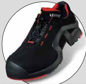
UVEX 1, 8516.2 (UVEX)