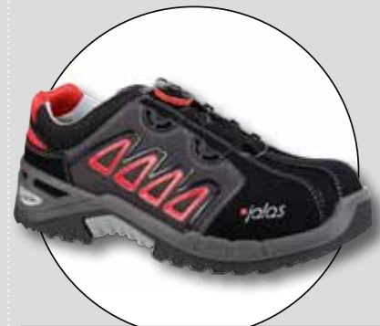
JALAS 9548 EXALTER EASYROLL (EJENDALS)