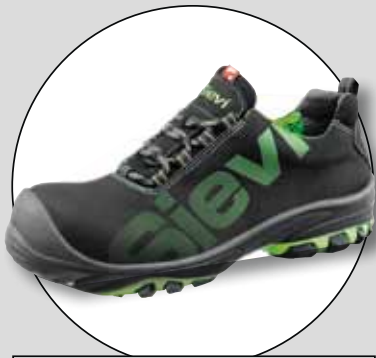
VIPER 2 (SIEVI)