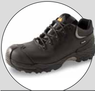
POWER HD MONITOR (BÅSTADGRUPPEN)