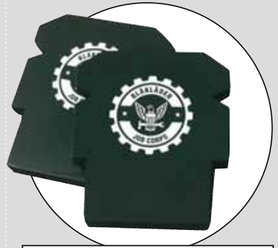
BLÅKLÄDER (HEAVY WEIGHT)