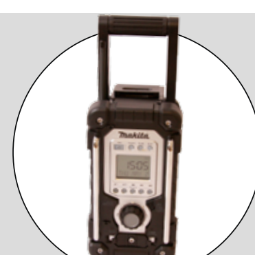
MAKITA (BMR 103B)