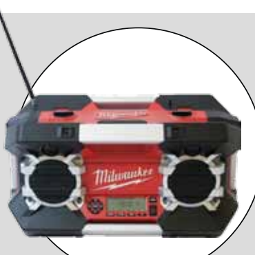
MILWAUKEE (C12-28 DCR)