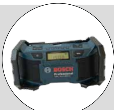
BOSCH (GML SOUNDBOXX PROFESSIONAL)