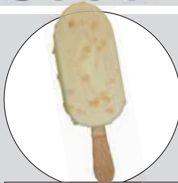
ROYAL SOMMARBÄR (TRIUMFGLASS)