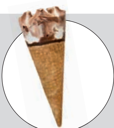
CORNETTO BRÖLLOPSSTRUT (GB)

Betygen på respektive testfaktor är ett medelvärde av testpiloternas betyg. Slutbetyget är en helhetsbedömning som sätts av redaktionen. Där vägs kommentarer och pris in.