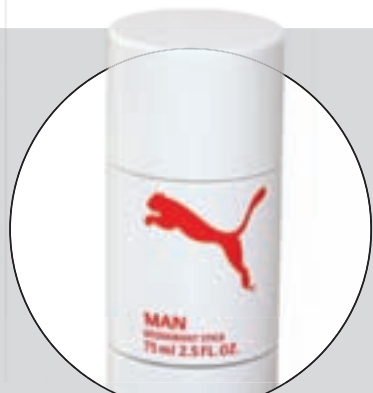
PUMA ("MAN" DEODORANT STICK)