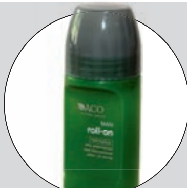
ACO ("MAN" ROLL-ON)