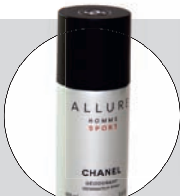
CHANEL ("ALLURE" HOMME SPORT SPRAY)

Resultatet på respektive testfaktor är ett medelvärde av testpiloternas betyg. Slutbetyget är en helhetsbedömning som sätts av redaktionen. Där vägs kommentarer och pris in.