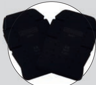
JOBMAN (KNÄSKYDD FÖR GOLVLÄGGARE)