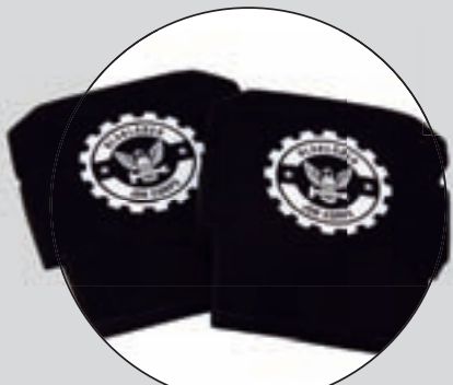
BLÅKLÄDER (HEAVY WEIGHT)

Resultatet på respektive testfaktor är ett medelvärde av testpilaternas betyg. Slutbetyget är en helhetsbedömning som sätts av redaktionen. Där vägs kommentarer och pris in.