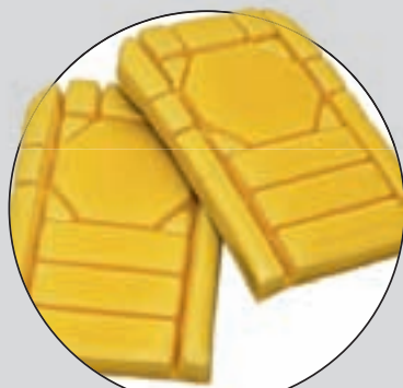
FRISTADS (KP 953)