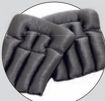
SNICKERS (KNÄSKYDD FÖR GOLVLÄGGARE)