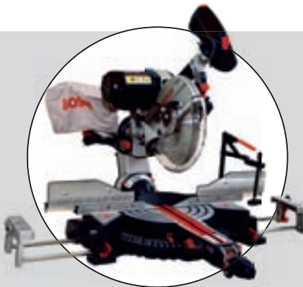
BOSCH GCM 10 SD PRO.