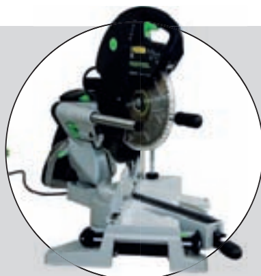
FESTOOL KAPEX KS 120

Betygen på respektive testfaktor är ett medelvärde av testpiloternas betyg. Slutbetyget är en helhetsbedömning som sätts av redaktionen. Där vägs kommentarer och pris in.