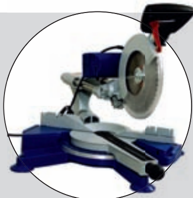
METABO KGS 303 PLUS

Bra att greppet går att ställa om. Bordet glappar något. Otympig. Klingskyddet är förbannat jobbigt. Smarta inställningslösningar.