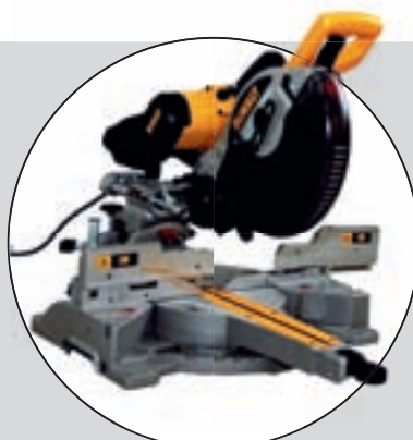
DEWALT 717 XPS