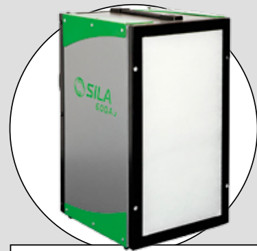
SILA (600 AZ)