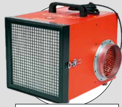
PULLMAN ERMATOR (A600U)