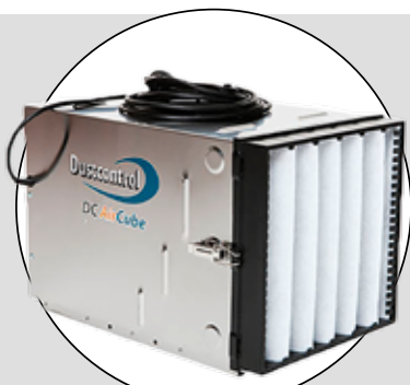
DUSTCONTROL (DC AIRCUBE 500)