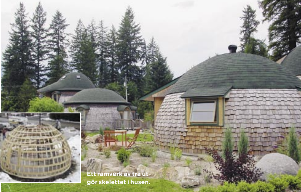
Ett ramverk av trä utgör skelettet i husen.