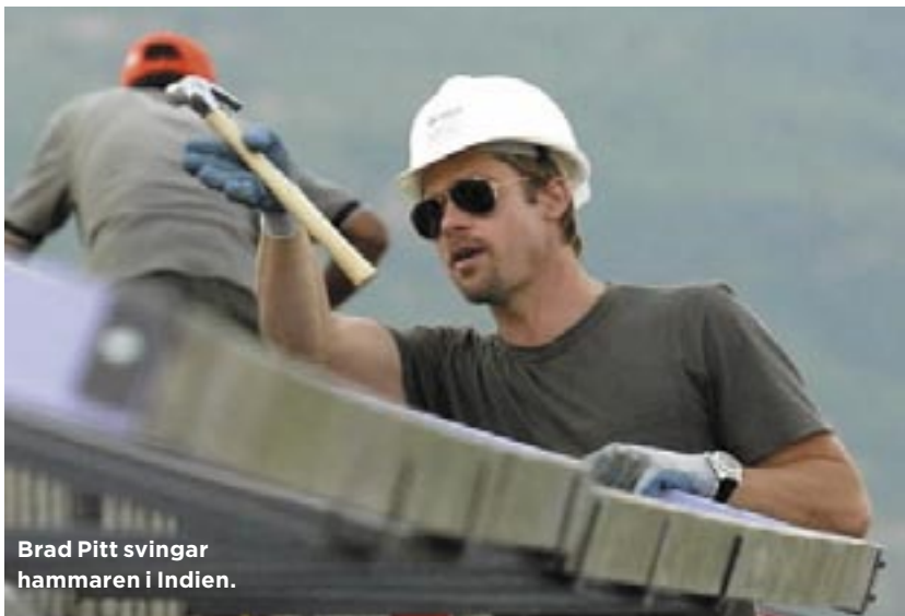
Brad Pitt svingar hammaren i Indien.