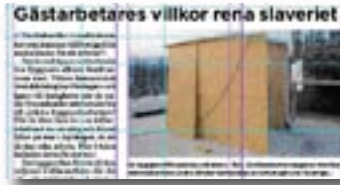
Byggnadsarbetaren nr 1/07

För det mesta hade de ingen kännedom om vare sig avtal eller andra rättigheter. Många ansåg att de kom och stal jobben och de fick förnedrande smeknamn.