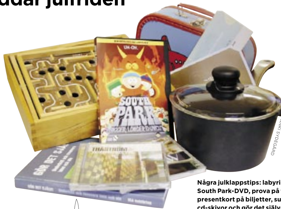
Några julklappstips: labyrintspel, South Park-DVD, prova på flygning, presentkort på biljetter, superkastrull, cd-skivor och gör det själv-bok.