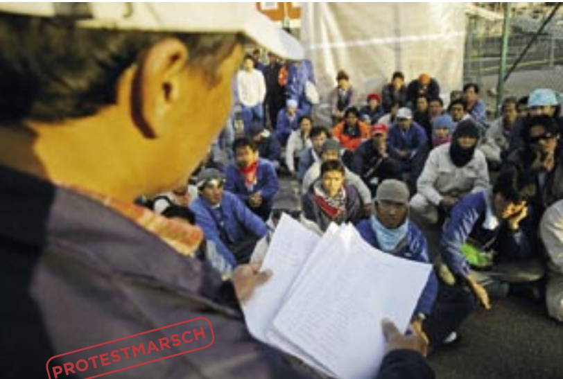
De thailändska arbetarna på Preemraff i Lysekil protesterade mot usel lön och lögner genom att marschera från jobbet. Byggnadsarbetarna som armerade formen till portalen på Törnskogstunneln utanför Stockholm hade 27 centimeter högt på jobbet.