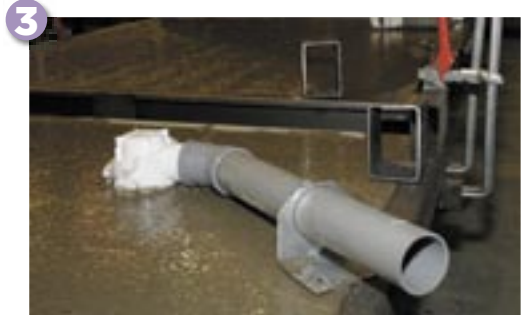
1. Maskinen sätter en kakelplatta var tredje sekund. 2. Fogning görs fortfarande manuellt, men snart tar maskinen över. 3. Badrummets golv gjuts i formar som vänds efter en natts härdning. Även golvklinker kommer snart att sättas maskinellt hos badrumstillverkaren Partab i Kalix.