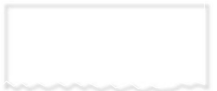
Ur Byggnadsarbetaren nr 17.

Ett exempel: ”Polska företag betalar lägst lön, cirka 109 kronor i timmen.” Varför hävdas inte Byggnads avtal?