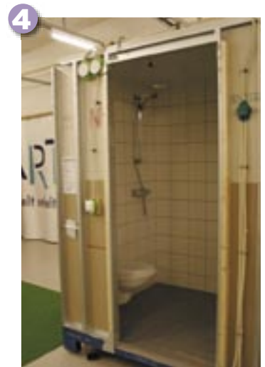
4. Badrum klart för leverans. Ledningar och installationer provtrycks innan de färdiga badrumsmodulerna lämnar fabriken.