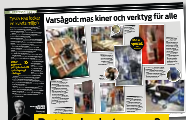
Byggnadsarbetaren nr 2.

I BYGGNADSARBETAREN NR 2/2015 rapporterade vi från byggmässan Bau i München. Här kommer mer från mässan som är den näst största i Europa, efter franska Batimat.