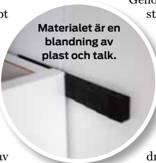
Materialet är en blandning av plast och talk.

Almi trodde på deras idé och bidrog med 15 000 kronor i bidrag till att ta fram ett gjutverktyg. De har också fått hjälp med mönsterskydd och patentansökan.