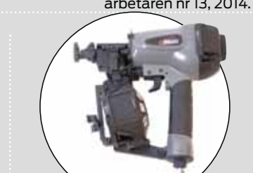
AERFAST (ANC 45 R)