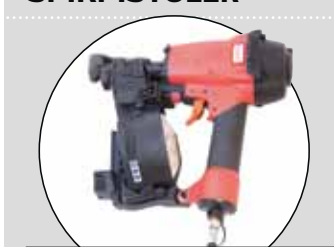
HAUBOLD (RNC 45 R)

Publicerad i Byggnadsarbetaren nr 13, 2014.