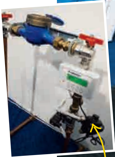
Vattenfelsbrytaren monteras intill vattenmätaren och stänger av tillförseln om en läcka skulle uppstå.

droppande kranar eller rinnande toalettstolar.