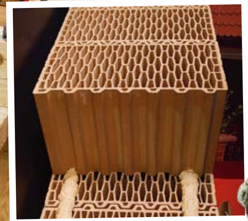
Porotherm Dryfix heter detta byggsystem från Polen. Keramiska väggblock fixeras här med fogsium i stället för med traditionellt murbruk.