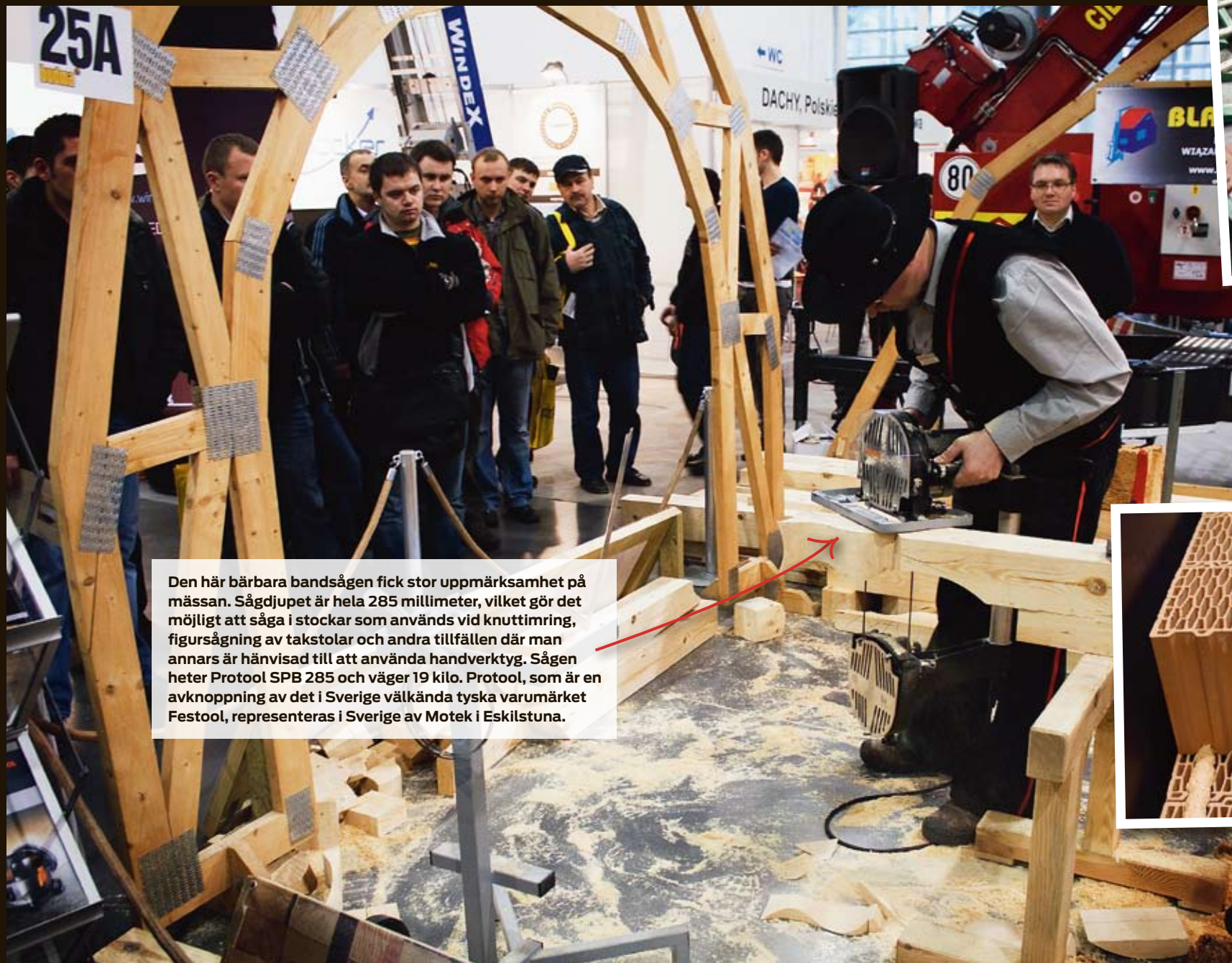
Den här bärbara bandsågen fick stor uppmärksamhet på mässan. Sågdjupet är hela 285 millimeter, vilket gör det möjligt att såga i stockar som används vid knuttimring, figursågning av takstolar och andra tillfällen där man annars är hänvisad till att använda handverktyg. Sågen heter Protool SPB 285 och väger 19 kilo. Protool, som är en avknoppning av det i Sverige välkända tyska varumärket Festool, representeras i Sverige av Motek i Eskilstuna.