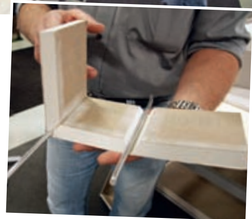
Den nya tyska fräsmaskinen premiärvisades i Skandinavien vid byggmässan Scandbuild i Köpenhamn. Den är bland annat till för inbyggnader av rörstammar.

Eftersom det inte blir några synliga skarvar behövs ingen spackling, inte heller armering eller förstärkningsbeslag. Tidsbesparingen blir rejäl samtidigt som man uppnår en pre-