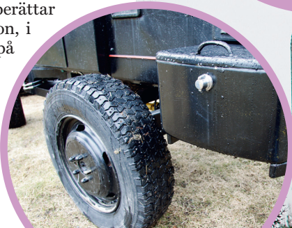
Hjulen kommer från en van och låsvredet från en Volvo.