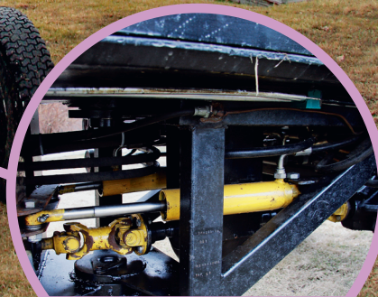
Kraftöverföringen hörde till det svåraste att bygga.