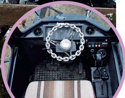
Hytt med Volvoinredning och egen ratt.