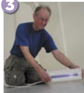
3. Ultraviolett ljus avslöjar om skarven är otät.

2. När våderna läggs i hop underlättar det om man är två, som hjälps åt med jobbet. Den färdiga skarven blir nästan osynlig.